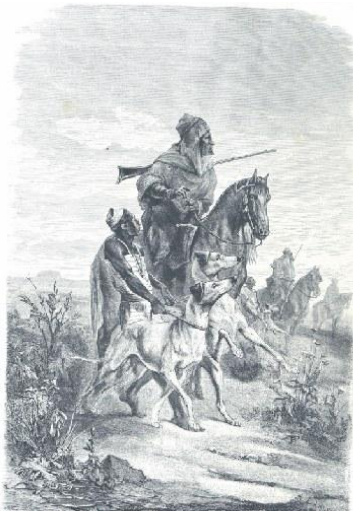
Sloughis Algériens par A. LANÇON

Cliquez SVP sur ce lien pour lire la suite : http://www.algerieconfluences.com/?p=13261