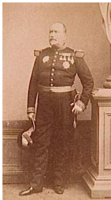
Eugène DAUMAS (1803/1871) : https://fr.wikipedia.org/wiki/Eug%C3%A8ne_Daumas

NDLR : Le sloughi, également appelé lévrier marocain ou lévrier berbère, est un lévrier originaire d'Afrique du Nord. Le général DAUMAS a consacré à ce sujet un chapitre dans son livre : « Les Chevaux du Sahara et les Moeurs du Désert », 1852