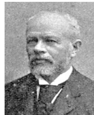
Louis TIRMAN (1837/1899) https://fr.wikipedia.org/wiki/Louis_Tirman