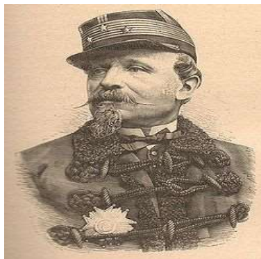
Antoine CHANZY (1823/1883) https://fr.wikipedia.org/wiki/Alfred_Chanzy