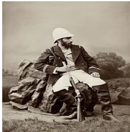
[Brazza dans les années 1880]

Pour cette expédition qui dure de 1875 à 1878, il se munit de toiles de coton et d'outils pour le troc. Il est seulement accompagné d'un docteur, d'un naturaliste et d'une douzaine de fantassins sénégalais. Brazza s'enfonce dans l'intérieur des terres et réussit à nouer de bonnes relations avec la population locale, grâce à son charme et son bagout. Son expédition est toutefois un échec du point de vue de son but d'origine, mais une réussite d'exploration, car il a bien démontré que les deux fleuves sont différents. En tout état de cause, le 11 août 1878, Brazza et ses compagnons d'exploration, fatigués et malades, décident de faire demi-tour.