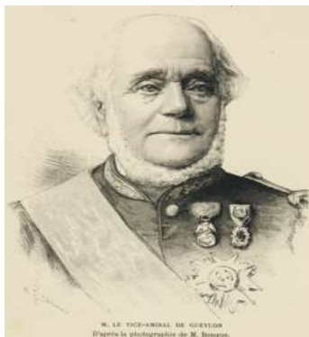
Louis de GUEYDON (1809/1886) https://fr.wikipedia.org/wiki/Louis_Henri_de_Gueydon

La nomination des gouverneurs généraux désireux d'implanter des colons français sur l'ensemble du territoire. Trois gouverneurs généraux ont mis la colonisation rurale au premier rang de leurs préoccupations :