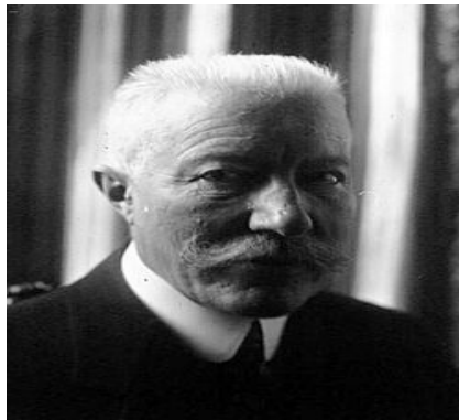
Charles Célestin JONNART (1857/1927) : https://fr.wikipedia.org/wiki/Charles_Jonnart