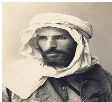
SAVORGNAN de BRAZZA (1852/1905) : https://fr.wikipedia.org/wiki/Pierre_Savorgnan_de_Brazza

L'origine du nom est des plus faciles à expliquer. C'est un hommage rendu quelques mois après sa mort à Pietro Paolo SAVORGNAN de BRAZZA que nos dictionnaires qualifient de grand explorateur et de colonisateur pacifique. Son nom est rattaché au Congo (Ndlr : Voir sa biographie au chapitre 2).