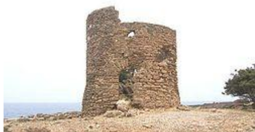
[Vestige de la tour de guet à La Calle]

Son emplacement se situait sur celui de Tuniza, ville mentionnée sur des voies de l'empire romain, dressée au III e siècle. Tuniza, dans l'antiquité punique et romaine, du berbère "Tounes" ou bivouac, devint Marza El Kharaz "le port aux breloques", puis Mers El Djnoun, port de la baie, et La Calle de massacres, et finalement La Calle ou bastion de France, le plus important de tous les comptoirs de pêcheurs de coraux.