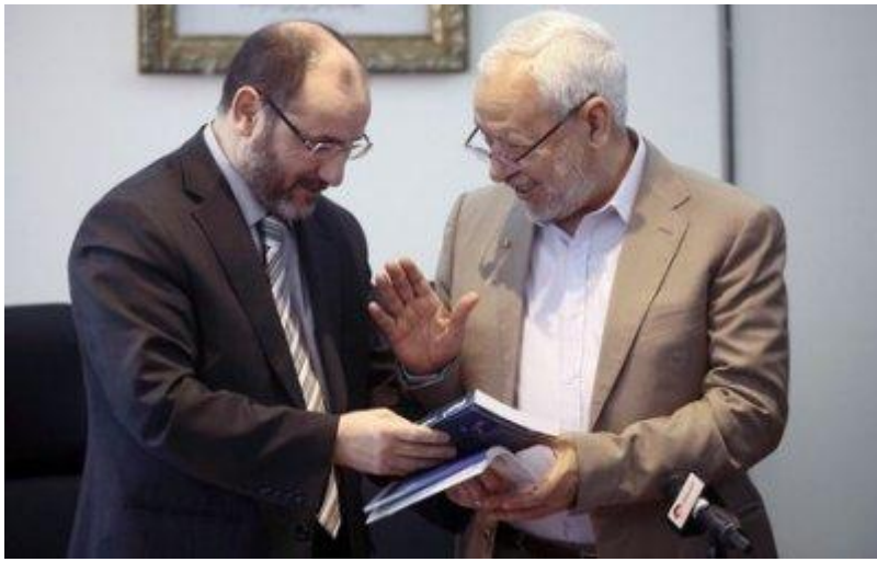
[Abderrezak Mokri (à gauche) et Rached Ghannouchi. Une alliance transfrontalière. ]

Chose légitime, diraient les citoyens épris de démocratie, mais la longue expérience vécue par l'Algérie depuis le milieu des années 80 à ce jour montre clairement que toutes les organisations qui fondent leur activisme politique sur la religion, en jouant sur la fibre sentimentale, qu'elles se revendiquent du salafisme, du wahhabisme ou de toute autre doctrine extrémiste, ne peuvent se passer de la violence pour imposer leurs idées rétrogrades. En Egypte, où l'armée a dû intervenir pour sauver la république d'un basculement évident vers un régime d'apartheid, menaçant de fait les minorités et, pis, l'intégrité d'un pays à l'économie exsangue et à la pauvreté exponentielle, l'organisation vieille de plus d'un demi-siècle est en voie d'être démantelée.