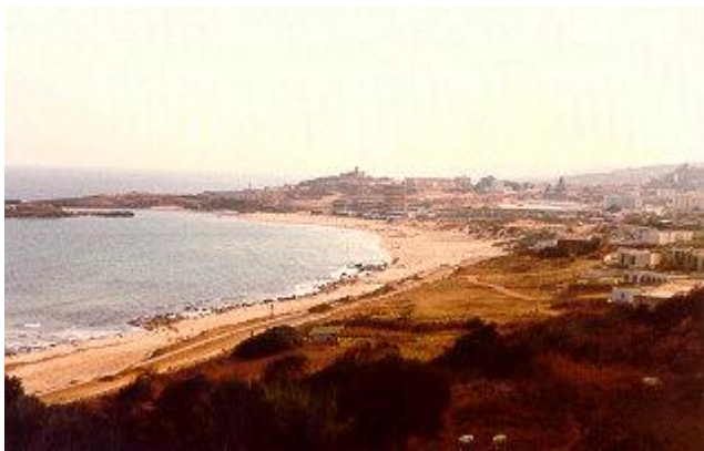
[La plage de La calle]