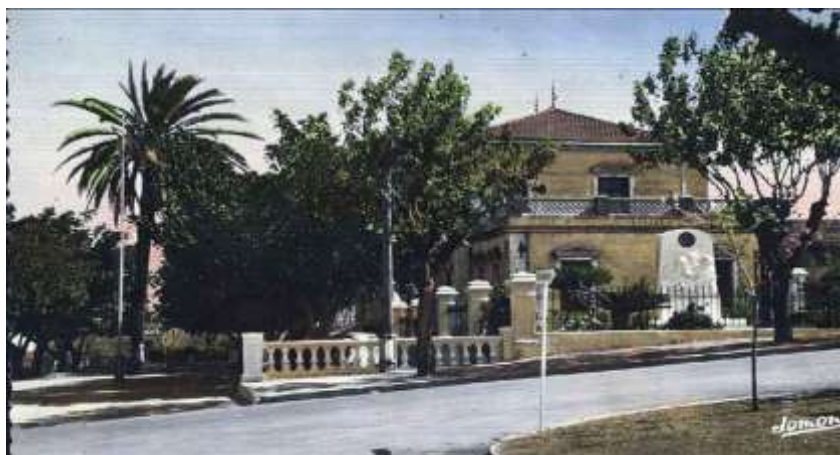
Mairie de TEFESCHOUN

Tefeschoun, situé sur la colline, derrière un bois de pins, était essentiellement habité par des viculteurs d'origine alsacienne. Là se trouvait la Mairie. Un autre petit port de pêche, Bou-Haroun, complétait cette commune.