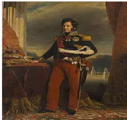
LOUIS PHILIPPE (1773/1850) : https://fr.wikipedia.org/wiki/Louis-Philippe_Ier

LOUIS-PHILIPPE ne se préoccupait guère de peupler l'Algérie.