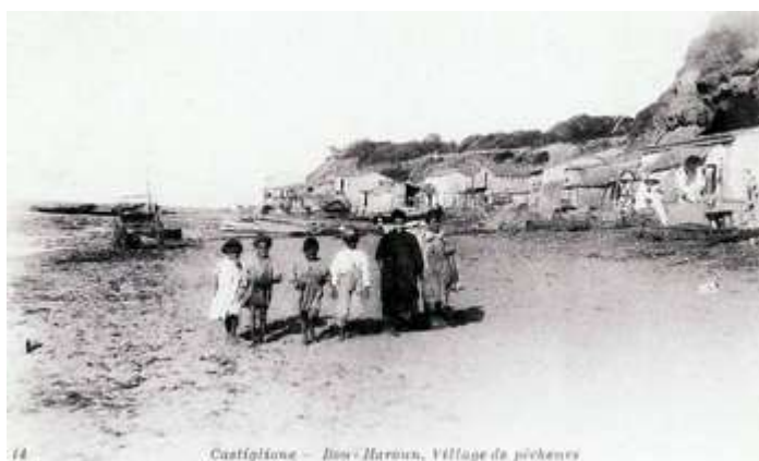
14 Castiglione - Bou Haroun, Village de pêcheurs

Familles : BAGUE - BALLU - BEAUMENT - BECK - BERTINIER - BOISSEAU - CAVE - CHAILLOU - CHEVALOT - DREVON - DUCROCQ - DUMONT - DUVAL - ECKERT - FERRE - FIAQUE - FOURNIER - FRANCOIS - GABALDOT (ou GALBADOT) - GADAN - GARNIER - GAVELOT - GRENOT - GUILLEMAIN - HEBERT - HOURY - JUBREAU - JUMAIN - KERMADEC - LAMBERT - LEDOUX - LENGLET - LENICOLAS - LEPRET (ou LESPET) - LEVEILLE - MANOURY - MATHET - MENAGER - MERVILLE - MEUNIER - MONGEON - MORIN - MOUGEOT - MOYNAT - PATOUILLOT - POINCELIN - RENOULT - RIBRION - ROBERT - ROCHEREAU - SEVIN - TETU - THIBERT - TONDEUX - TROCHARD - VILLEMOT - WERNDL -