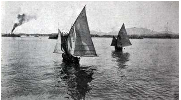
Les fameuses Balancelles