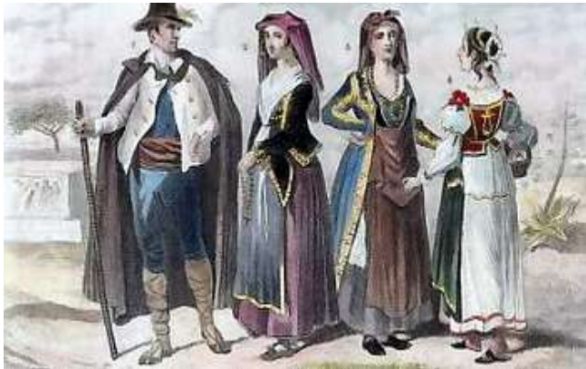
Italiens d'ISCHIA et de PROCIDA

des transactions sont consacrées au rachat d'esclaves avec le développement de la course et l'installation des Barberousse à Alger. Une riche famille génoise, les Lomellini avait obtenu les droits d'exploiter une concession de corail à Tabarka depuis le 16 ème siècle prenant le relais des français. On note que : Des flottilles de pêcheurs de Pantellaria et de Sicile abordaient les côtes africaines, procédaient à la salaison sur place, séchaient leurs filets avant leur port d'attache. En 1817, 200 pêcheurs corailleurs sont égorgés par les Barbaresque dans une église de Bône. En 1824, le Royaume de Naples nomme un représentant permanent à Alger.