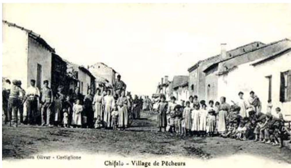
Chifalo - Village de Pêcheurs

Les italiens ont participé aux développements de la pêche, de l'industrie de la pêche (salaisons, conserveries) et des compagnies maritimes.