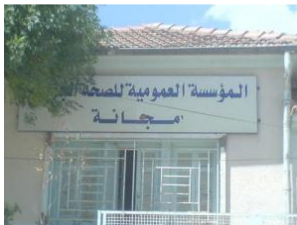
Centre sanitaire de MEDJANA

1949 : Construction à EL MAÏN d'une maison commune, Construction d'un lavoir à MEDJANA, Construction d'une salle de délibérations pour la Djemâa à MEDJANA, Réfection de la salle de la Mairie d'EL ACHIR ainsi qu'un abattoir, Construction d'un logement pour le secrétaire interprète de MEDJANA, Réfection du lavoir de BLONDEL,