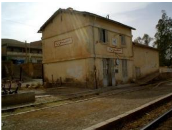
Gare de MANSOURAH

La voie ferrée traverse la Commune mixte (CM) et comporte quatre gares des Portes de Fer, de M'ZITA, de MANSOURAH et d'EL ACHIR,