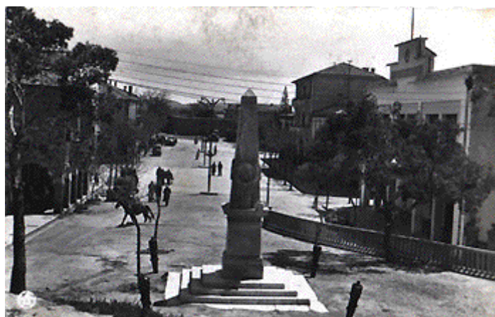
BORDJ-BOU-ARRERIDJ - Monument aux Morts de 1870 et Cours du CHEYRON

NDLR : Le chiffre précis des pertes des deux côtés n'a jamais été officiellement dévoilé.