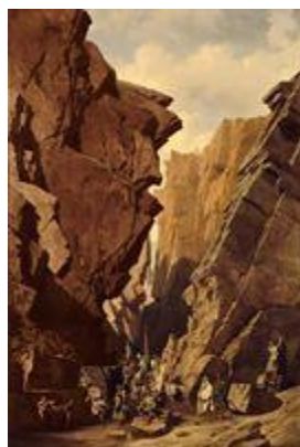
Les Portes de fer