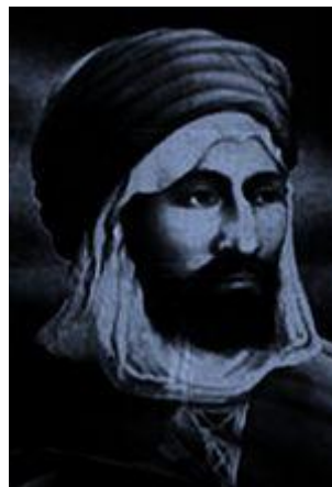
Cheikh EL MOKRANI Mohammed (1815/1871)

http://fr.wikipedia.org/wiki/Louis_Henri_de_Gueydon