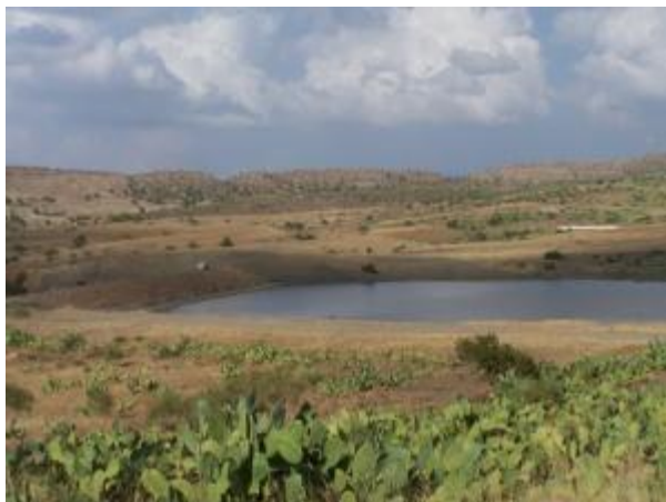
Barrage de BOUKABA

Toutes les rivières de la C.M. appartiennent au réseau hydrographique de la Méditerranée, toutes finissent pas se jeter dans la SOUMMAM. Les 190 sources sont presque toutes potables ; il n'existe pas de puits artésiens.