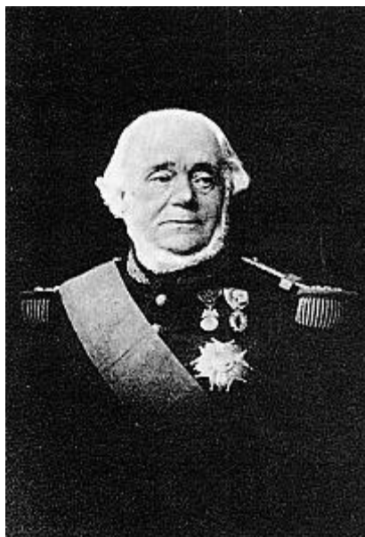
Amiral Louis, H. GUEYDON (1809/1886)

Bou-Mezrag MOKRANI est condamné à la peine de mort par la cour de Constantine le 27 mars 1873.