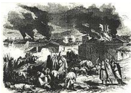
[Attaque de BORDJ BOU ARRERIDJ par les hommes du cheikh EI MOKRANI — Gravure de Léon Morel-Fatio, L'Illustration , 1871.]

MOKRANI présente alors sa démission en mars 1871, mais les militaires lui répondent que seul le gouvernement peut accepter celle-ci, puisqu'il ne dépend plus de l'autorité militaire. D'après Louis RINN, c'est la « goutte d'eau » qui le décide à se révolter.