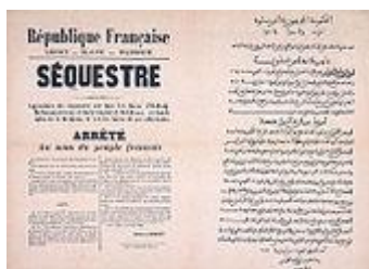
Affiche administrative (1871). Mise sous séquestre des biens d'EI MOKRANI.

La Kabylie se voit infliger une amende de 36 millions de francs-or. 450 000 hectares de terre sont confisqués et distribués aux nouveaux colons, dont beaucoup sont des réfugiés d'Alsace-Lorraine (suite à l'annexion allemande), en particulier dans la région de Constantine. Ces confiscations ont ensuite obligé de nombreux Kabyles à s'expatrier.