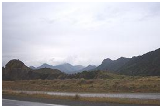
Chaîne des BIBANS

Elle occupe une situation intermédiaire entre les Hauts Plateaux (M'SILA – MAÂDID) et les montagnes de Kabylie (AKBOU – GUERGOUR), ce qui explique son aspect varié, tant au point de vue physique qu'humain.